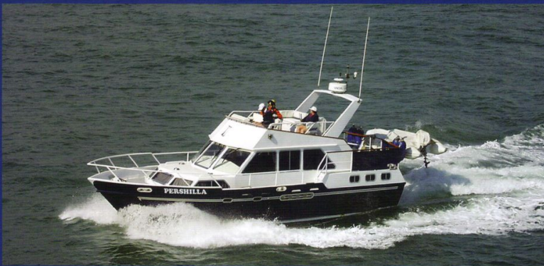
"MARINISER" UN MOTEUR : TOUS LES CONSEILS PRATIQUES

Au contraire d'un manuel d'atelier, qui ne fait que décrire certaines opérations de mécanique, cet ouvrage est un guide détaillé et pas à pas des principales opérations d'entretien, qui explique pourquoi elles sont nécessaires. Richement illustré, il constitue une lecture essentielle pour tous les utilisateurs de bateaux.