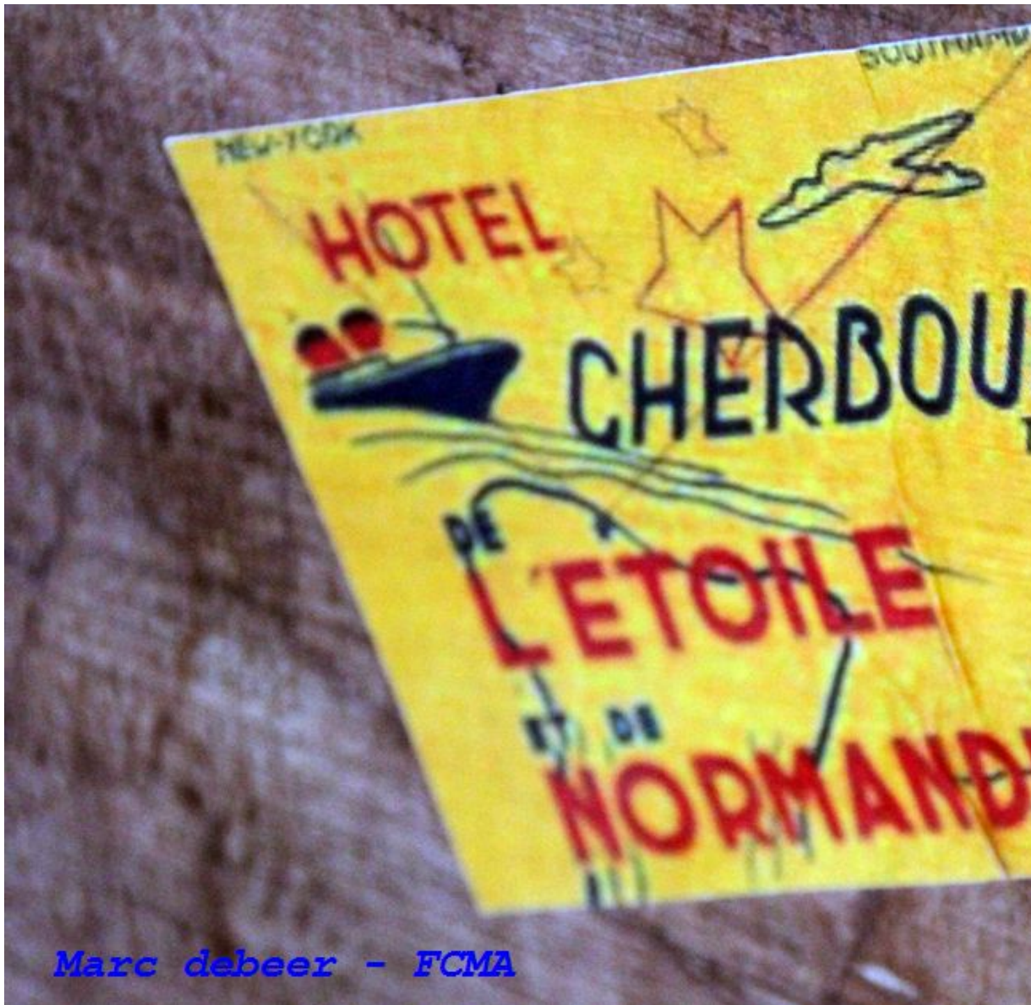
Marc debeer - FCMA